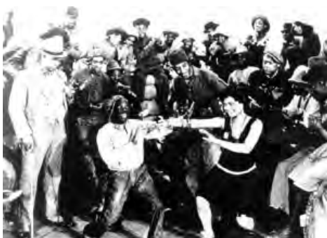
Hallelujah! de King Vidor

• King for a day de Roy Mack, avec Bill Robinson, 1934