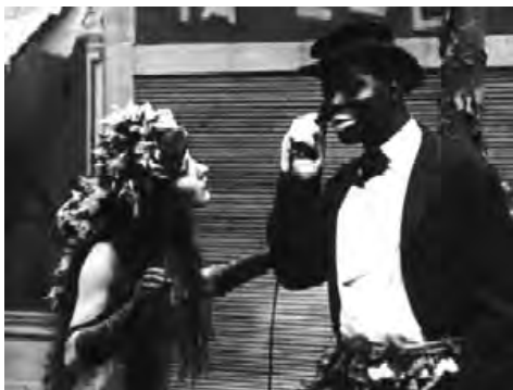
Sur un air de charleston de Jean Renoir