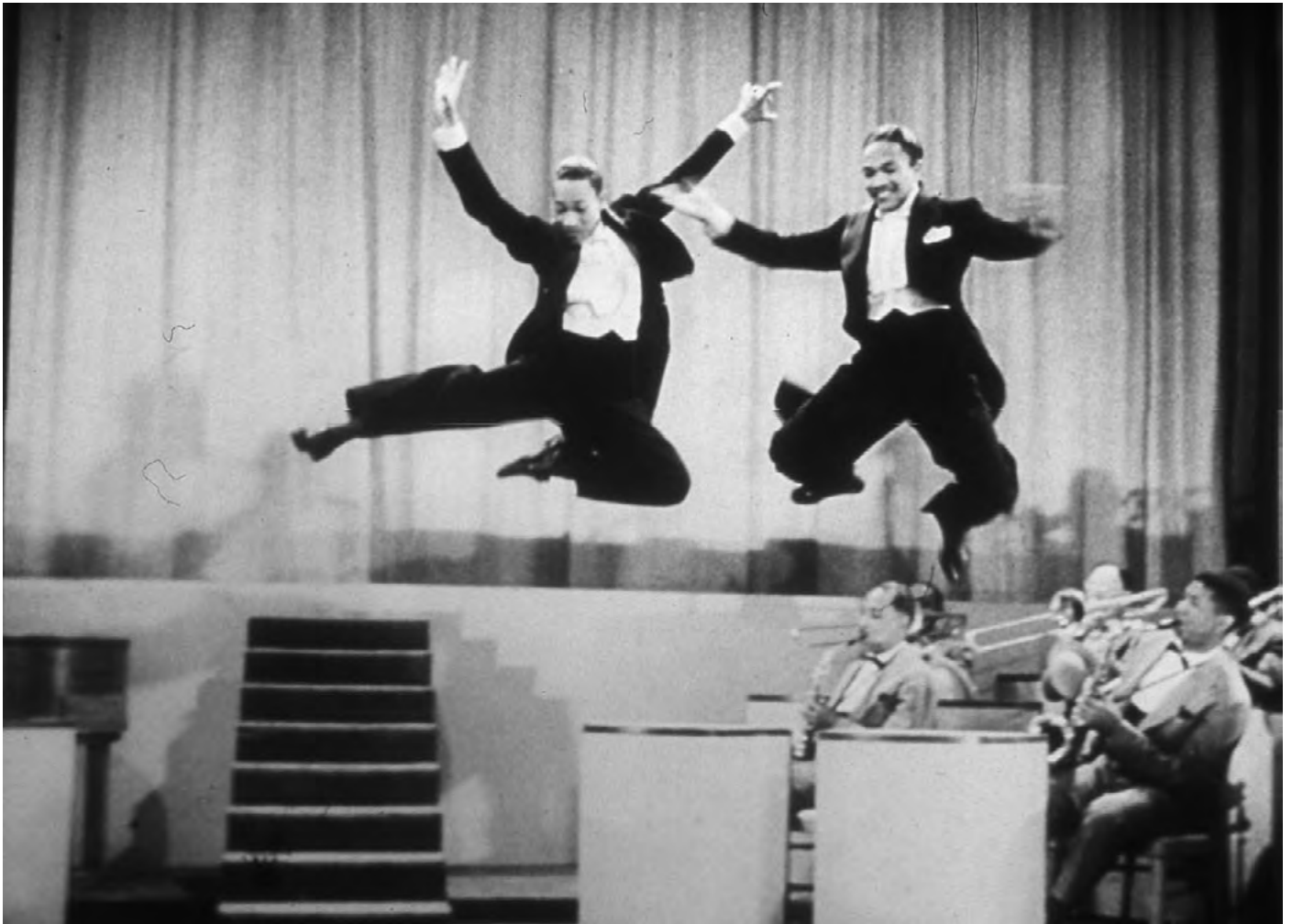
Nicholas Brothers