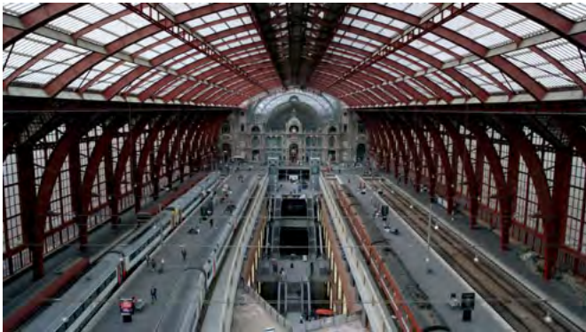
Antwerp central station de Peter Krüger, 2010