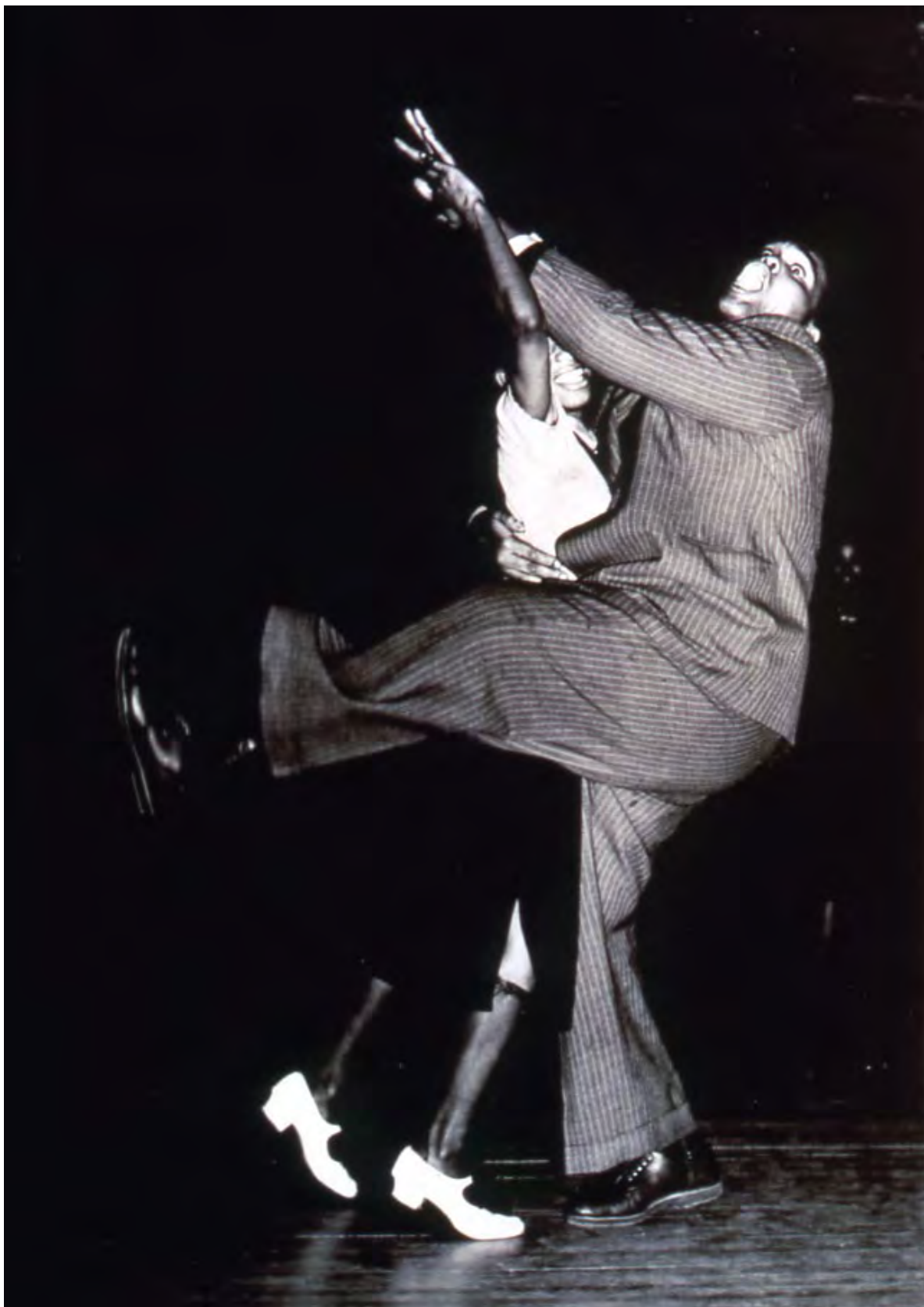
Savoy Ballroom/ La Cinémathèque de la Danse