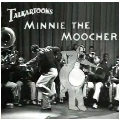
Minnie the Moocher de David Fleischer

• Les hallucinations d'un pompier avec Joséphine Baker, Collection Lobster Films, 1927