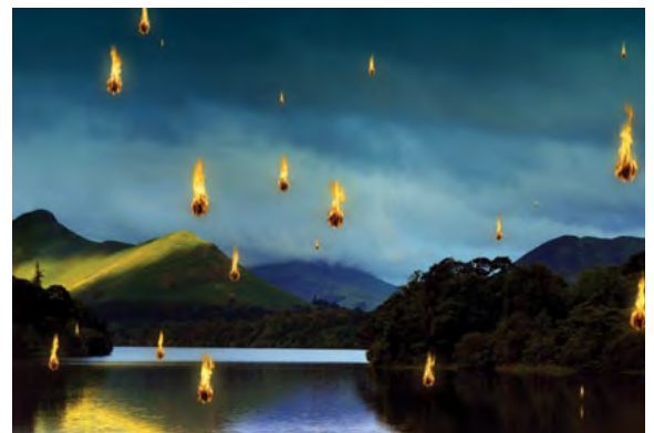
Exiles of the Shattered Star , Kelly Richardson, 2006