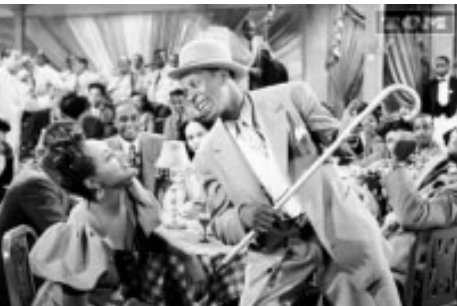
Cabin in the sky de Vincente Minnelli