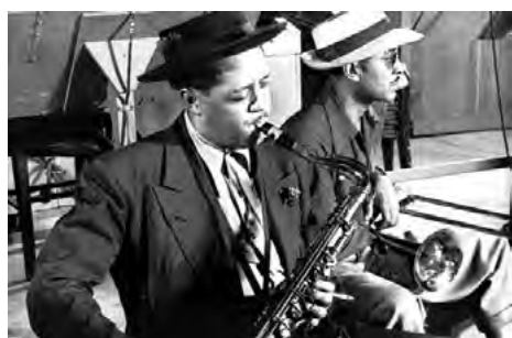
Lester Young dans Jammin' the Blues