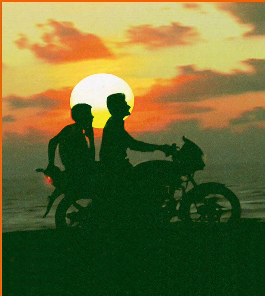
Voyage à Gaza de Piero Usberti, 2023