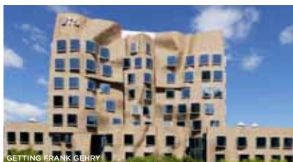
GETTING FRANK GEHRY

À 84 ans, avec un grand nombre de bâtiments légendaires à sa feuille de route, Frank Gehry (né en 1929) n'a plus rien à prouver. Réputé pour ses structures métalliques libres et chatoyantes qui défient la logique et paraissent animées, Gehry a radicalement réinventé l'architecture. Le film suit son nouveau projet audacieux, l'Université de Technologie à Sydney, en Australie, et explore les quatre grandes périodes créatives de la carrière controversée de cet architecte iconoclaste, illustrées par quatre chefs-d'œuvre : la Maison Gehry, le Musée Vitra, le Guggenheim à Bilbao et le MIT Stata Center.