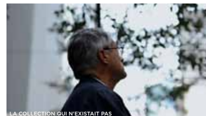
LA COLLECTION QUI N'EXISTAIT PAS

© LA COLLECTION QUI N'EXISTAIT PAS DE JOACHIM OLENDER