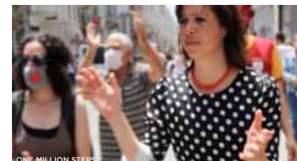
ONE MILLION STEPS

Une danseuse fait des claquettes, tandis qu'autour d'elle, les gens se ruent pour échapper au gaz lacrymogène de la police. Sommes-nous dans deux mondes séparés ? S'il n'y avait pas cette brèche inattendue au sol, juste en face de la danseuse... Elle décide alors de sauter et atterrit au milieu des émeutes sociales à Istanbul. Elle est témoin de la lutte du peuple pour sa liberté personnelle et son espace vital, et en profite pour transformer sa danse en une déclaration de solidarité.