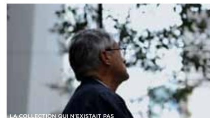
LA COLLECTION QUI N'EXISTAIT PAS

© LA COLLECTION QUI N'EXISTAIT PAS DE JOACHIM OLENDER