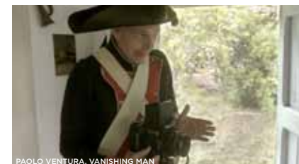
PAOLO VENTURA, VANISHING MAN