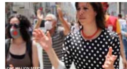
ONE MILLION STEPS

Une danseuse fait des claquettes, tandis qu'autour d'elle, les gens se ruent pour échapper au gaz lacrymogène de la police. Sommes-nous dans deux mondes séparés ? S'il n'y avait pas cette brèche inattendue au sol, juste en face de la danseuse... Elle décide alors de sauter et atterrit au milieu des émeutes sociales à Istanbul. Elle est témoin de la lutte du peuple pour sa liberté personnelle et son espace vital, et en profite pour transformer sa danse en une déclaration de solidarité.