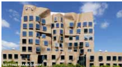
GETTING FRANK GEHRY

À 84 ans, avec un grand nombre de bâtiments légendaires à sa feuille de route, Frank Gehry (né en 1929) n'a plus rien à prouver. Réputé pour ses structures métalliques libres et chatoyantes qui défient la logique et paraissent animées, Gehry a radicalement réinventé l'architecture. Le film suit son nouveau projet audacieux, l'Université de Technologie à Sydney, en Australie, et explore les quatre grandes périodes créatives de la carrière controversée de cet architecte iconoclaste, illustrées par quatre chefs-d'œuvre : la Maison Gehry, le Musée Vitra, le Guggenheim à Bilbao et le MIT Stata Center.